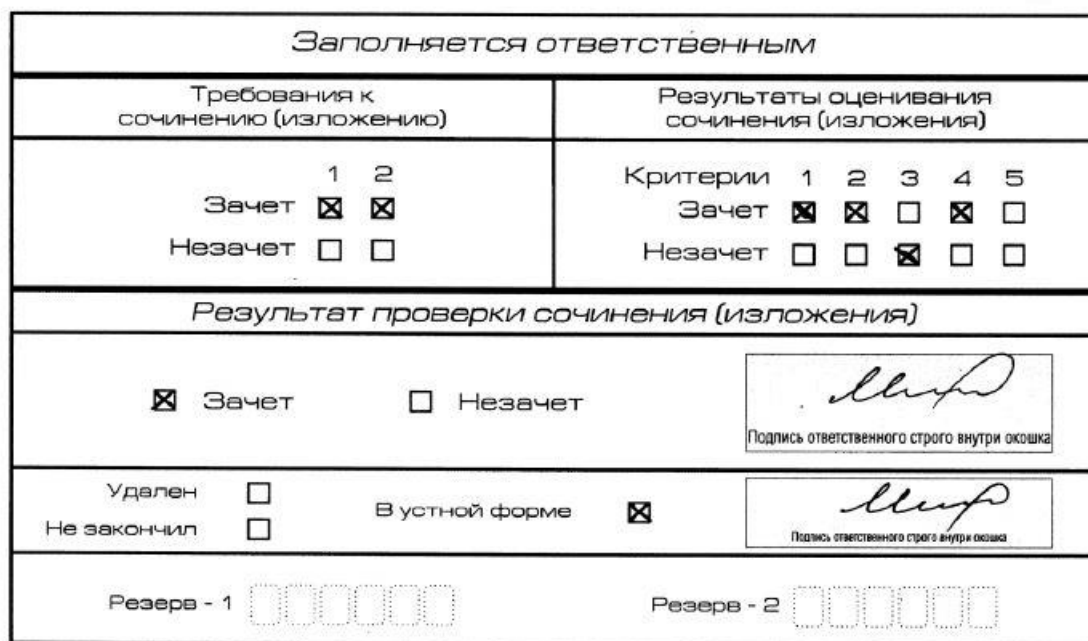
Рис. 10. Область для оценки работы сочинения (изложения) в устной форме

После окончания заполнения бланка регистрации ответственное лицо ставит свою подпись в специально отведенном для этого поле.