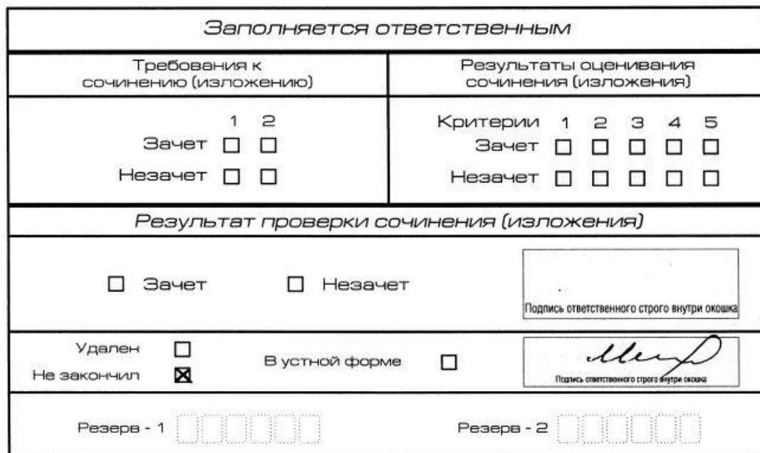
Рис. 11. Заполнение полей нижней части бланка регистрации (участник не закончил написание сочинения (изложения) по уважительным причинам)

сочинения (изложения) необходимо внести отметку «X» в поле «Не закончил» для учета при организации проверки, а также для последующего допуска указанных участников к повторной сдаче итогового сочинения (изложения) в дополнительные сроки. Внесение отметки в поле «Не закончил» подтверждается подписью члена комиссии по проведению итогового сочинения (изложения).