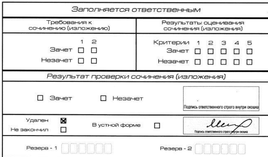
Рис. 12. Заполнение полей нижней части бланка регистрации (удаление с экзамена)